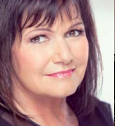
Maurane