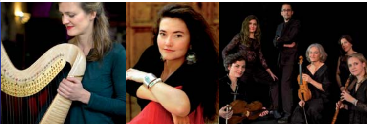
Ensemble Amarillis